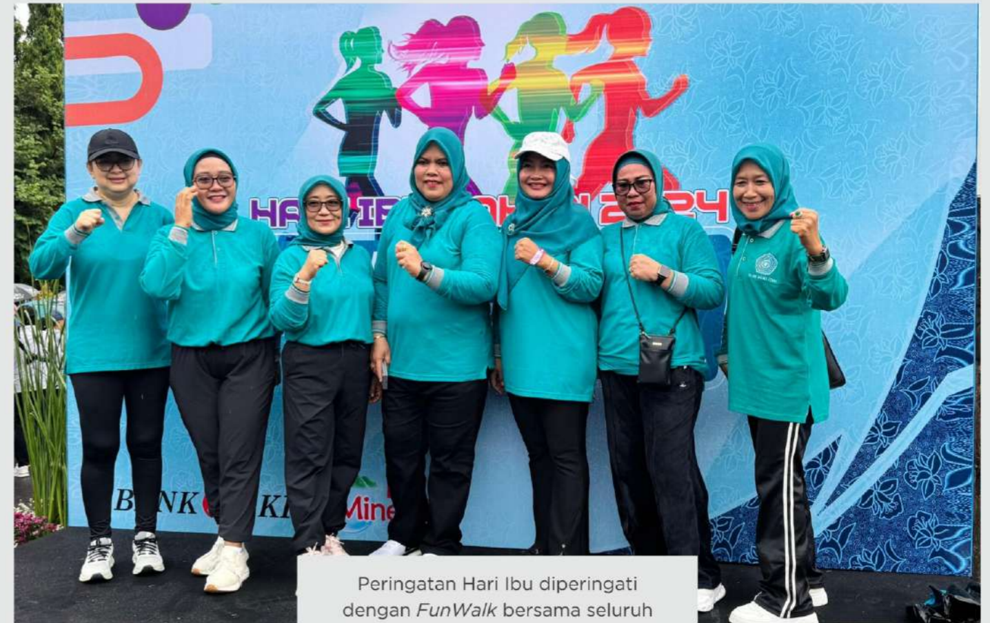
Peringatan Hari Ibu diperingati dengan FunWalk bersama seluruh ketua Tim Penggerak PKK se-Indonesia dan Ibu-Ibu Seruni