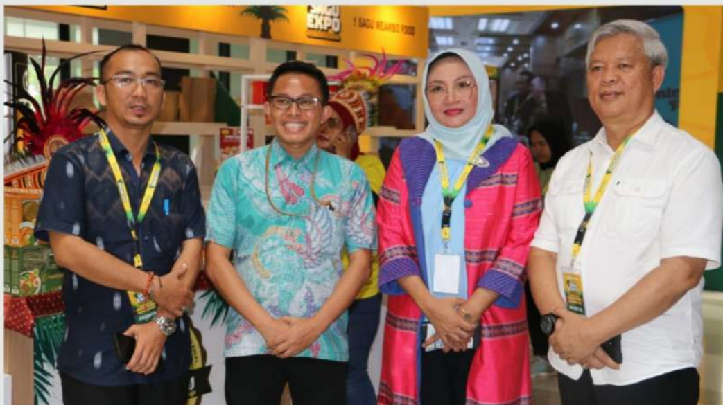
JAKARTA, 2 NOVEMBER 2024

Pada Pameran sago expo, Pj Ketua TP.PKK Provinsi Kepulauan Bangka Belitung di dampingi oleh Ketua Dinas Perindustrian dan Perdagangan, serta owner dari Sago mee