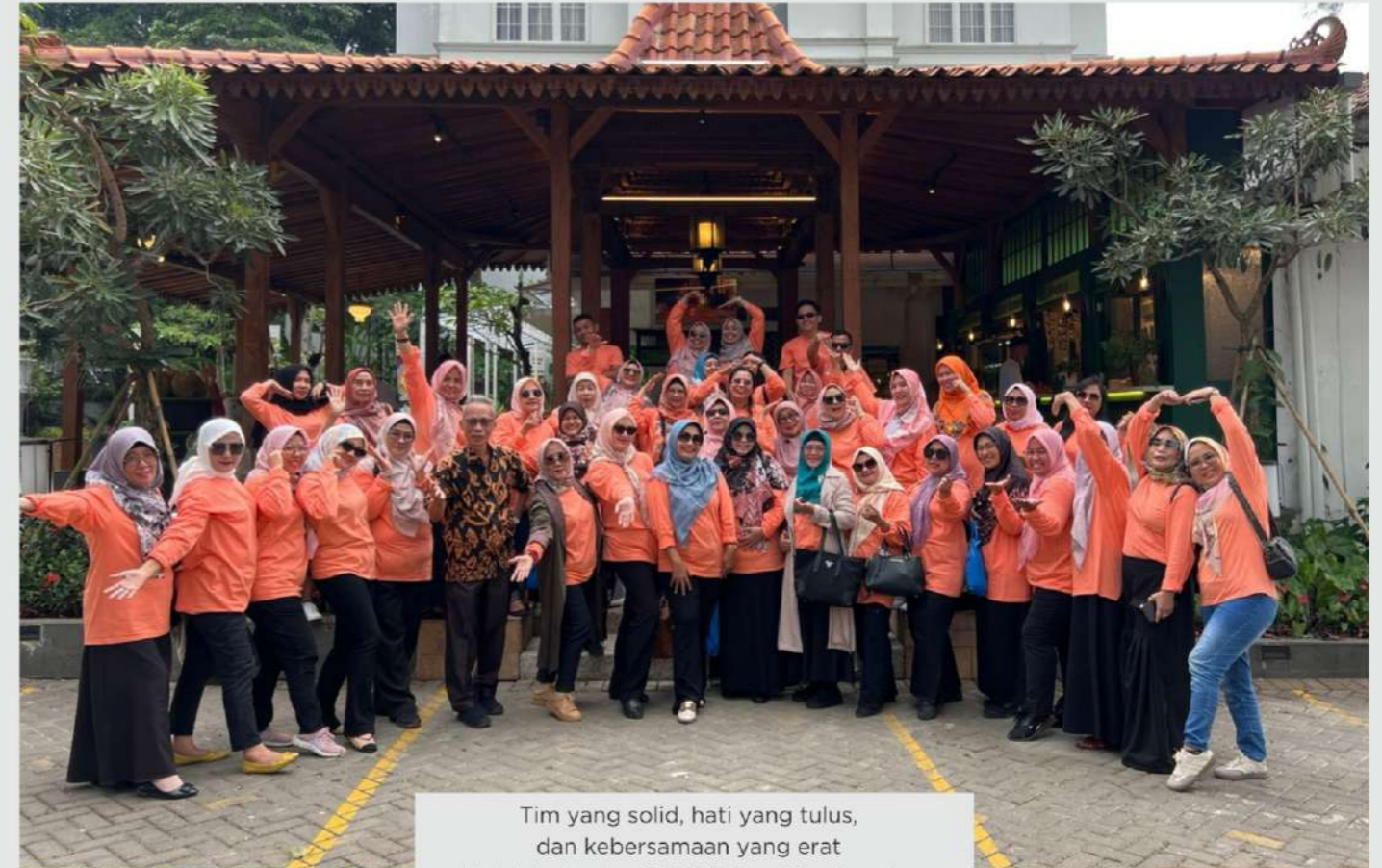
Tim yang solid, hati yang tulus, dan kebersamaan yang erat itulah kekuatan TP.PKK Prov.Kep.Bangka Belitung