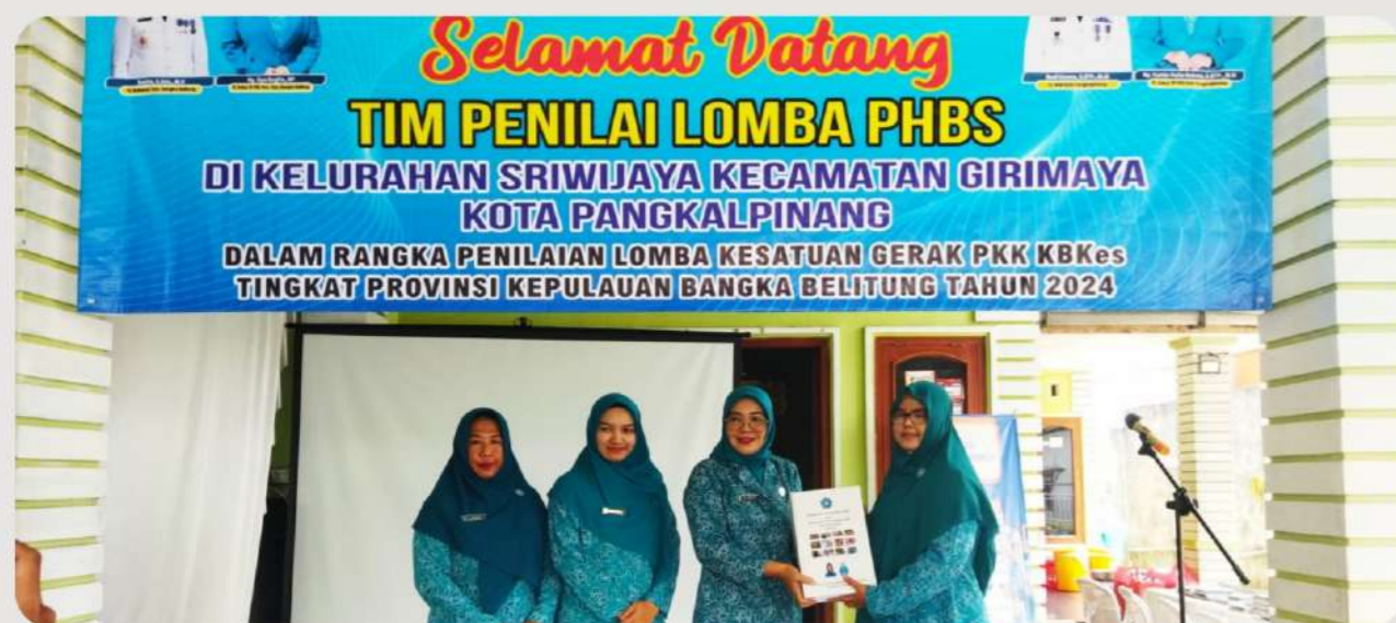
Penilaian Lomba Kesatuan Gerak PKK KB-Kesehatan Tingkat Provinsi Kepulauan Bangka Belitung di Kota Pangkal Pinang