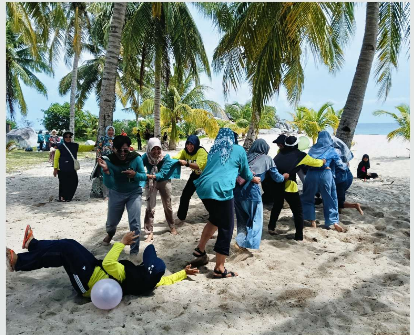
Foto: Pulau Lengkuas, Kabuten Belitung, Provinsi Kepulauan Bangka Belitung