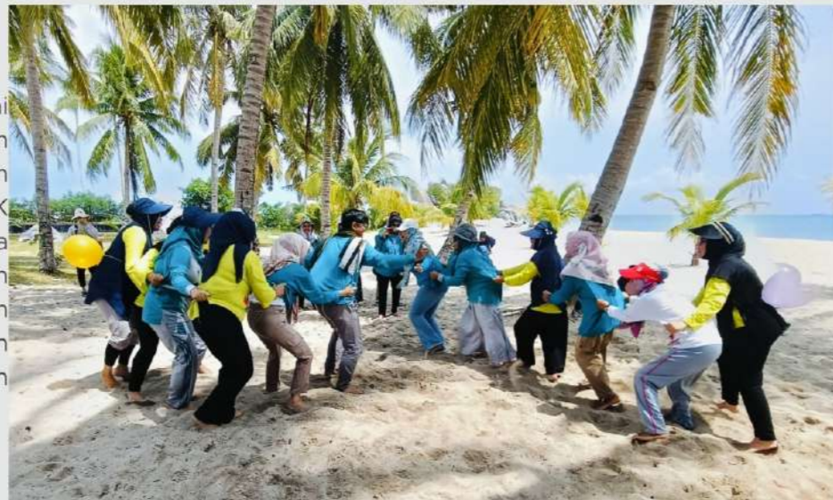
01 DESEMBER 2024

Tujuan kegiatan outbound ini adalah mempererat silaturahmi dan memperkuat koordinasi Tim PKK Provinsi dan Tim PKK Kabupaten. dengan adanya kegiatan ini diharapkan semakin solid, inovatif, dan efektif dalam menjalankan perannya dalam pemberdayaan keluarga dan masyarakat