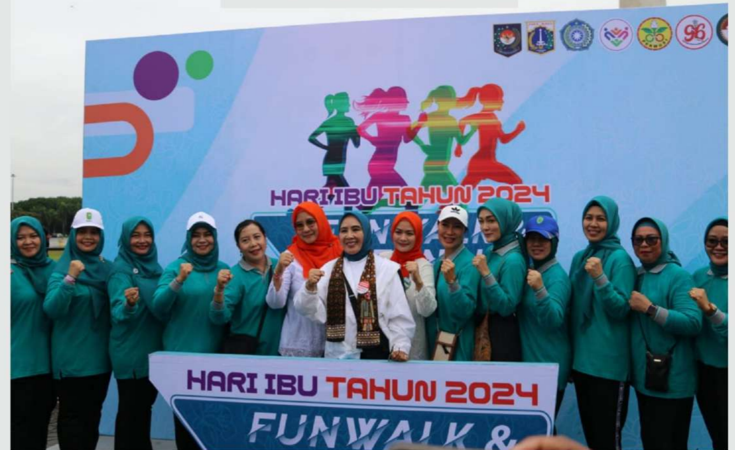
08 DESEMBER 2024