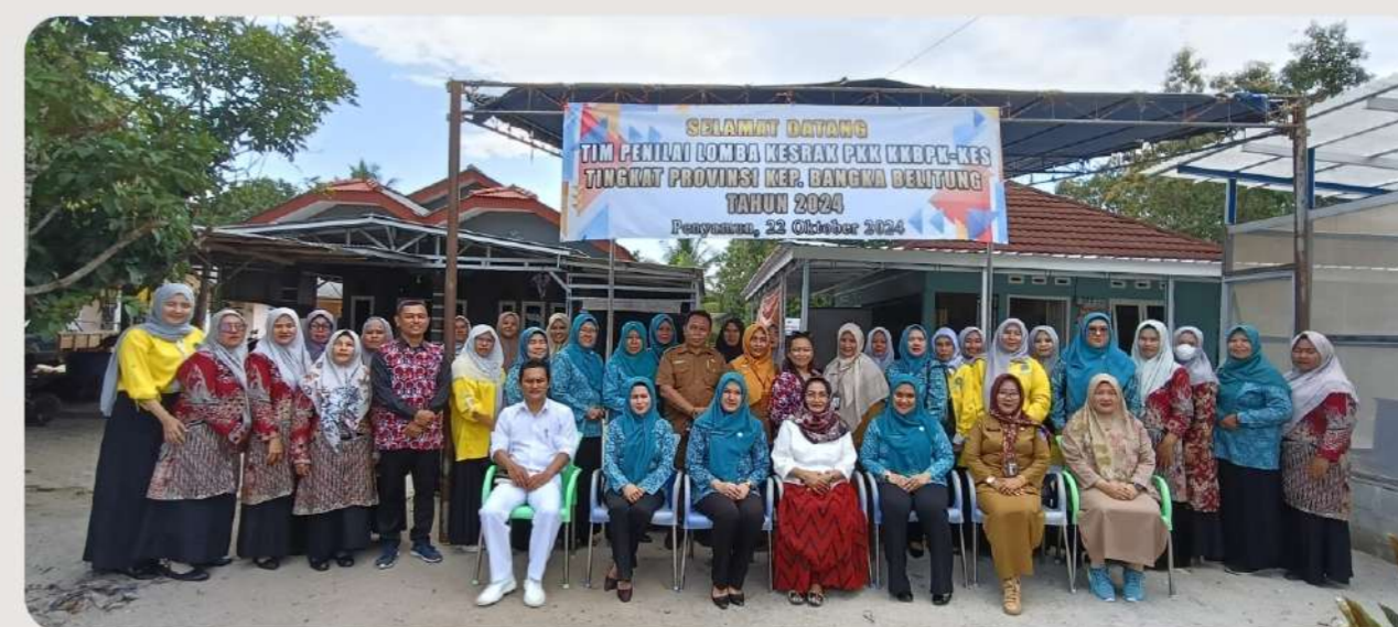
Penilaian Lomba Kesatuan Gerak PKK KB-Kesehatan Tingkat Provinsi Kepulauan Bangka Belitung di Kabupaten Bangka